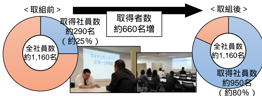
C社のマイナンバーカード取得状況